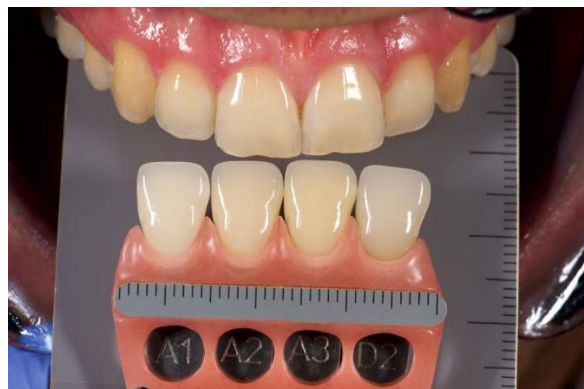
Фото культей с расцветкой, не обрезайте маркировку на расцветке.

Спасибо за профессиональное сотрудничество с цифровой зуботехнической лабораторией ViEstetic .